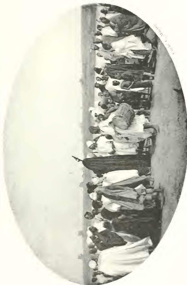
FIG. 8. — Le mama dyombo au milieu de l'assistance, pendant que l'on procède à la toilette des exercees.